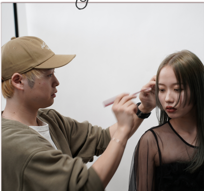
一瞬を切り取る撮影は真剣そのもの。 見せたいアングルの調整には余念なし。