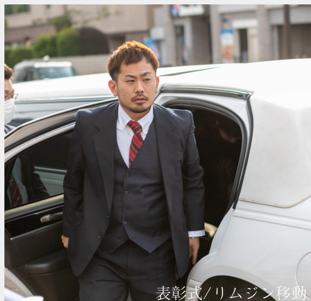
表彰式/リムジン移動