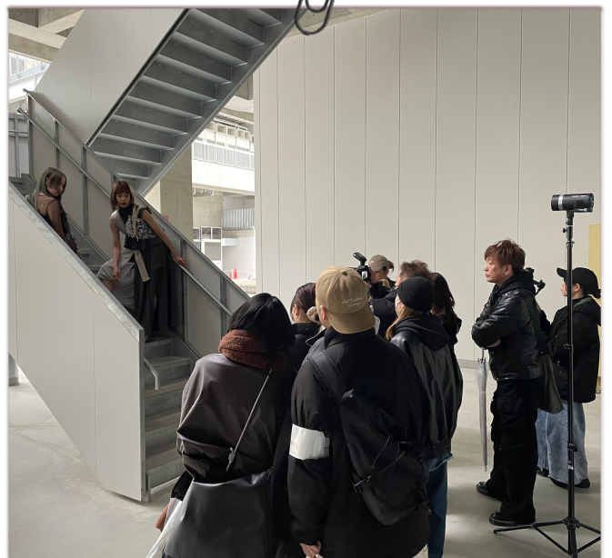
京都市立芸術大学のキャンパス。 まだ新しい事もあり都会的な雰囲気◎