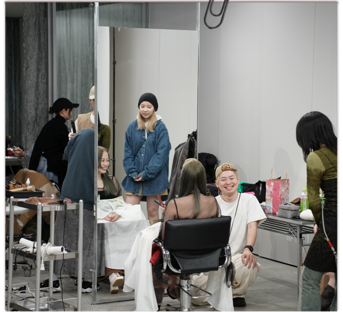
仕込みの時は和やかムード。 モデルさんの緊張を解きほぐします。