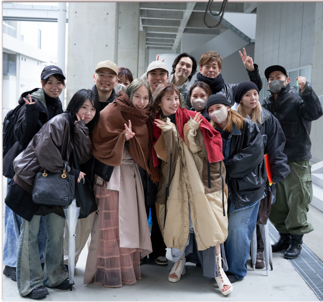
あいにくの雨。寒い中のロケ撮影。 みんな最後までやり抜きました。

2023/12から準備をすすめてきました。衣装も自分たちで調達し、リメイクして作製。幾度となく、打ち合わせや仕込みを重ねて、撮影当日を迎えています。撮影は、スタジオと、現在、店内アート展示でお世話になっている京都市立芸術大学の新キャンパスをお借りして行いました。