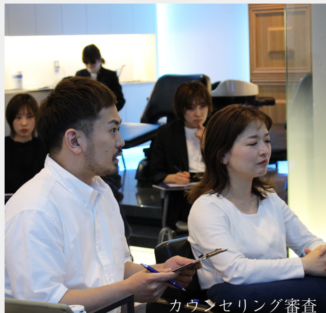
カウンセリング審査

予選では、審査員がお客様に紛れて来店され、実際の現場での技術や接客を審査されます。日頃のお客様へのサービス提供を評価され、振り返る事の出来る良い機会なので、今後も挑戦していきます。